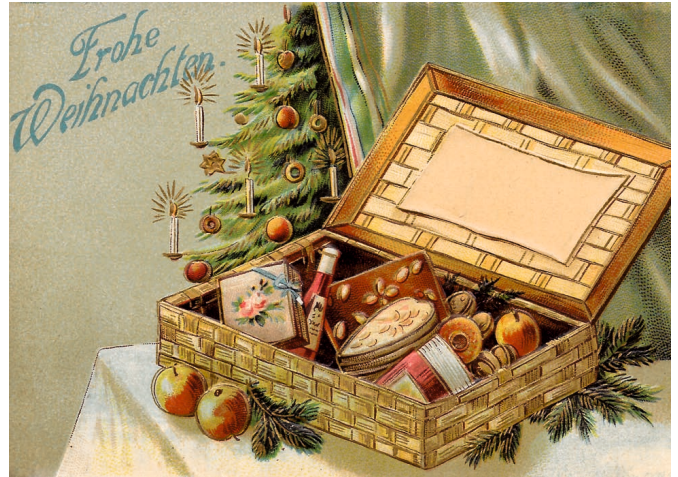
Der Vorstand, im Dezember 2023

Allen Mitgliedern, Spendern von Sachzeugen und Sponsoren sowie allen Einwohnern unseres Heimatortes wünscht der Vorstand des Heimatvereins Neukirchen/Pleiße e. V. ein frohes, friedvolles und gesegnetes Weihnachtsfest sowie recht viel persönliches Wohlergehen und Gesundheit im neuen Jahr!